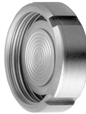
dargestellt Anschluß B DIN 11887